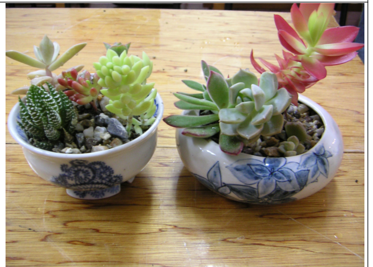
2日コース作品+サボテン