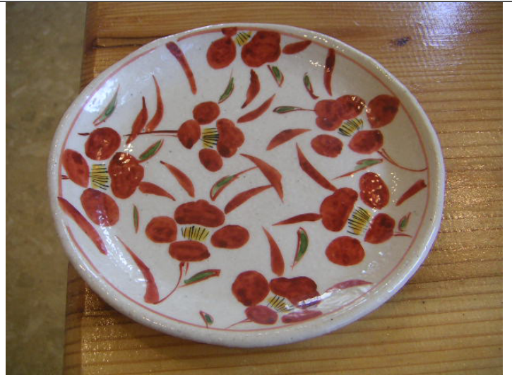
上絵・絵付けコース作品