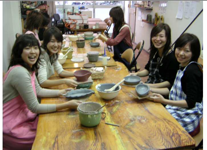
名古屋教室体験風景