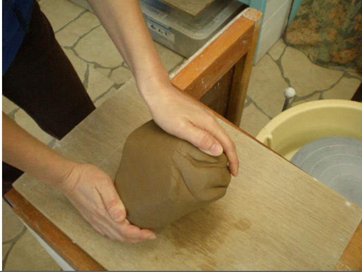
全プラン陶芸は土練りから始めます