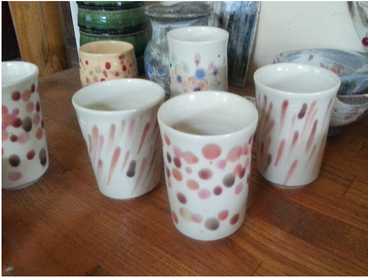
手びねり・ろくろコース作品