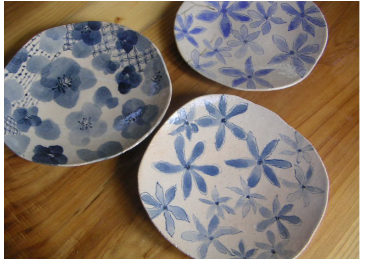
2日体験コース作品