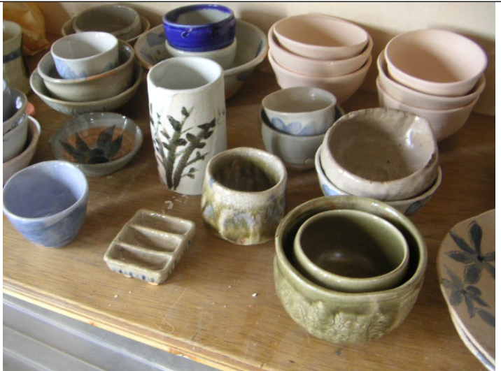
手びねりコース作品