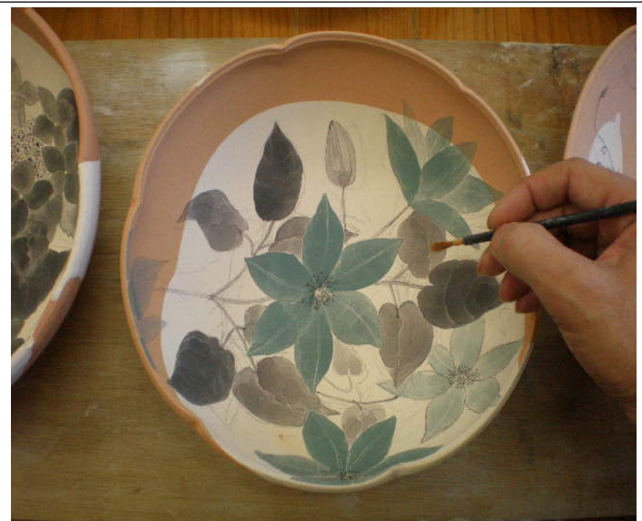
絵付けコース作品