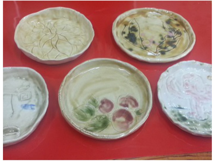
お皿板づくりコース作品