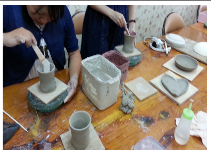
1日体験では絵付け・色付けまでします。